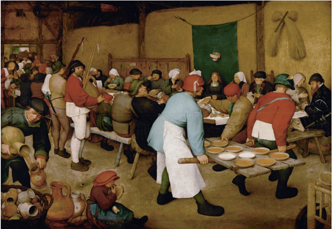
Le mariage paysan -Bruegel

« Le véritable esprit conservateur est autre chose. Il ne consiste pas à retourner en arrière, mais à remonter jusqu'à la source. Nous ne voulons pas répéter, mais renouveler. Et pour cela nous devons nous placer au centre même du jaillissement de l'histoire, c'est-à-dire au cœur de cette nature humaine et politique qui varie à l'infini dans ses manifestations, mais dont l'essence reste à jamais identique parce qu'elle se situe au-delà du temps. L'accident passe et se démode, l'être subsiste. Et si nous nous tournons souvent vers le passé, ce n'est pas par nostalgie de ce qui n'est