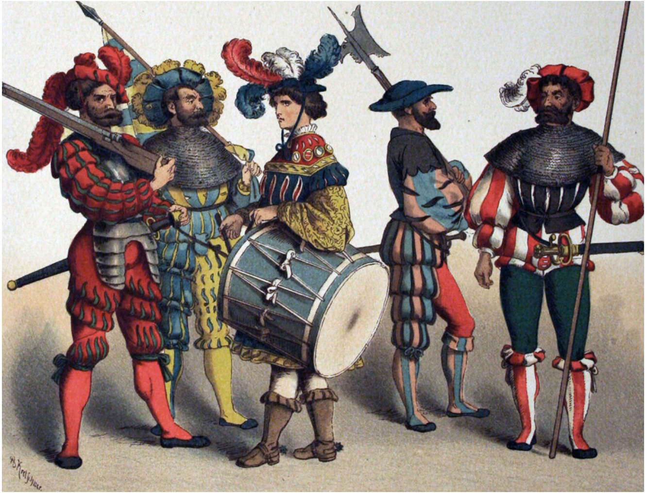
Groupe de lansquenets par Albert Kretschmer (1882)

« Oignez vilain, il vous poindra. Poignez vilain, il vous oindra. »