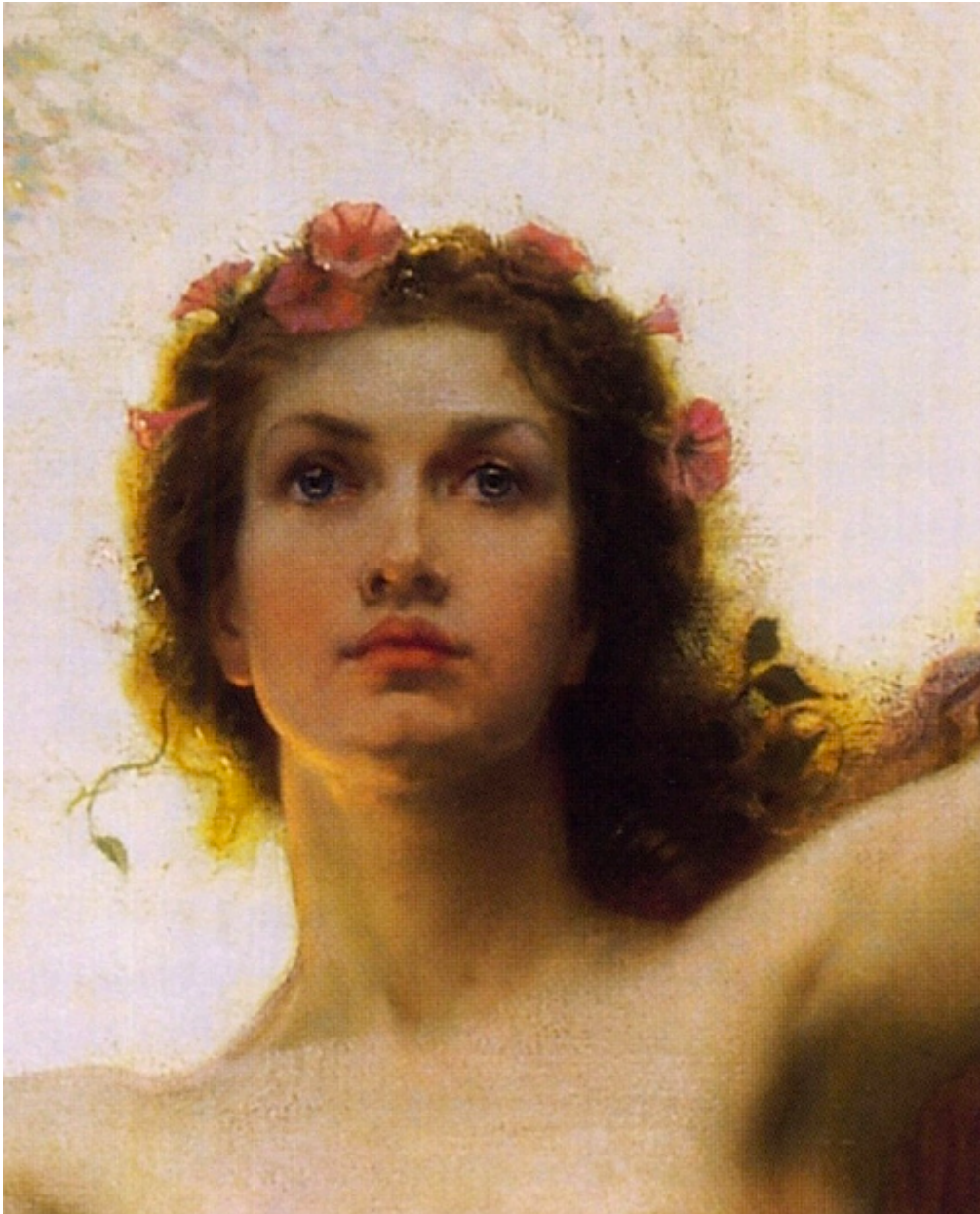
The Gates of Dawn by Herbet James Draper (detail)

« De celui dont nous disons qu'il est un 'homme de son temps', nous ne faisons que remarquer qu'il coïncide avec la majorité des imbéciles du moment. »