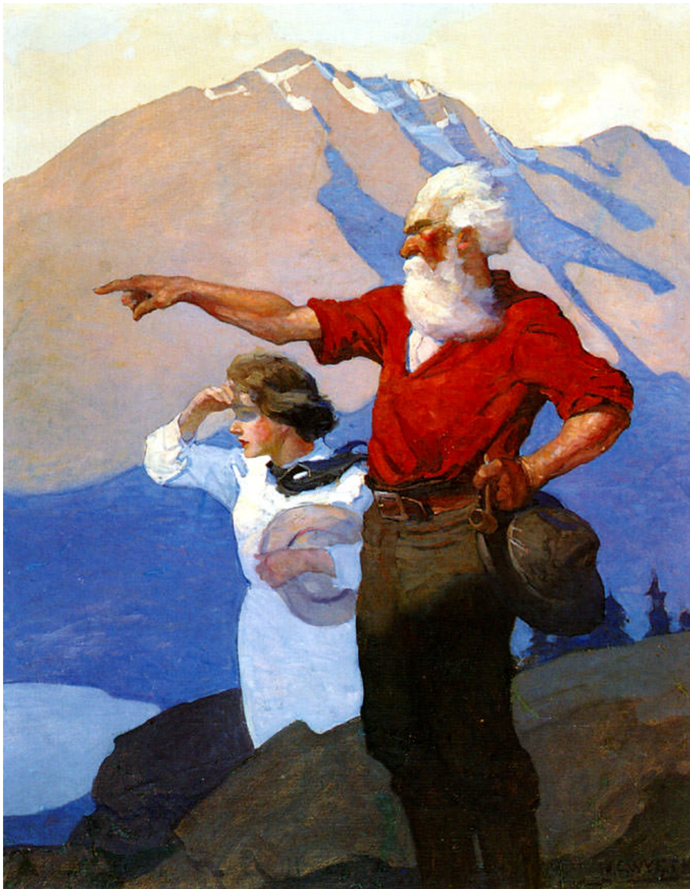
Newell Convers Wyeth – N.C.Wyeth Heidi, 1940 sqs