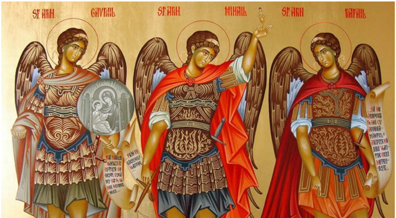
Icone des Saints Archanges, Michel, Gabriel, Raphaël #0pN

“Chaque fois que nous ouvrons la bouche, dix mille morts parlent à travers nous.” Hugo von Hofmannsthal