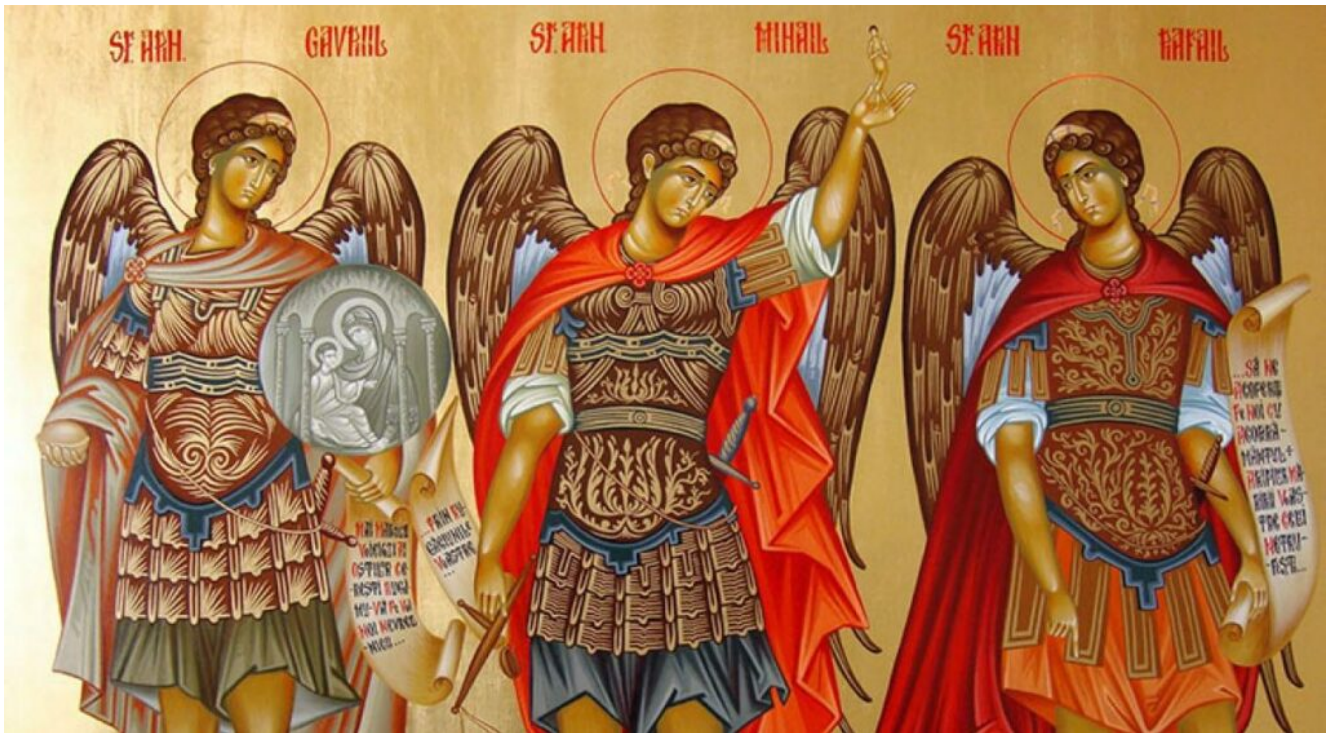
Icone des Saints Archange, Michel, Gabriel, Raphaël #0pN

“Chaque fois que nous ouvrons la bouche, dix mille morts parlent à travers nous.” Hugo von Hofmannsthal